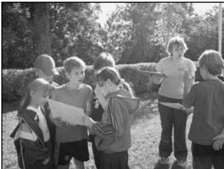
Tutvumas plaaniga enne orienteerumist

Sügise võtsime sellel aastal vastu maastikumängu tehes. Lapsed jaotati viide rühma, igale rühmale anti kätte kaart tingmärkidega.