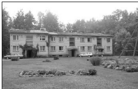
Eriauhind Saare tee 1 Taali külas