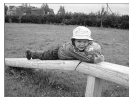
Lasteaial on valminud oma kodulehekülg www.torilasteaed.ee Tule ja vaata!