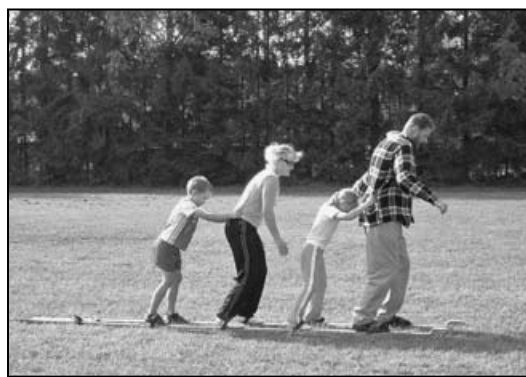
Üks vahvamaid alasid - suusatamine peredele