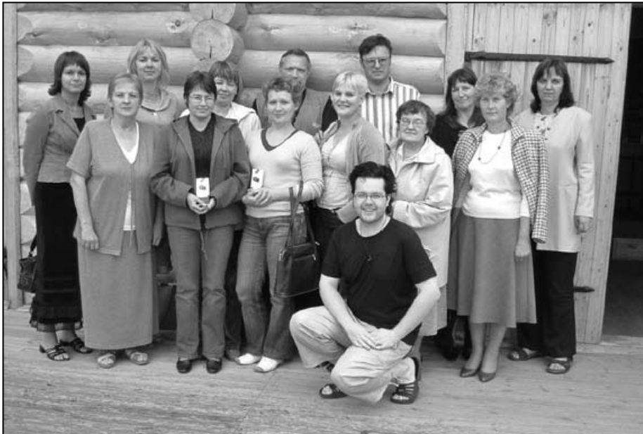
Vallavalitsuse liikmed ja allasutuste juhid hooaja avaüritusel Helmondis

Osahing Helmond rajab Tori valda Kõrsa külla puhke- ja ravikompleksi