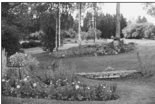
Lilleilu Tiituste aias

Elu käib siin koha peal juba kuuendat põlve.