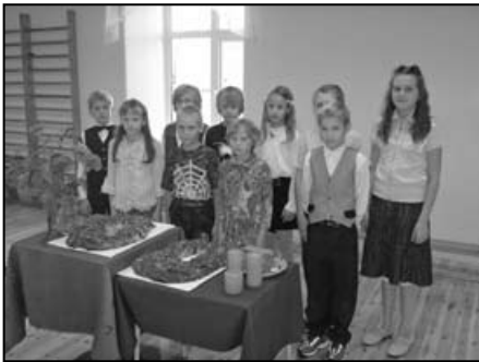
1. septembri kringlilaud Selja Algkoolis

Nüüd oleme juba mitu nädalat koolis käinud ning kooliellu rõõmsalt sisse elanud. Hommikuringides räägime sellest, milliseid sündmusi maailmas toimub, teeme liiklusemänge, mängime rollimänge sellest, kuidas võiks kaasõpilastega käituda, et meil siin kõigil väga hea õppida oleks.