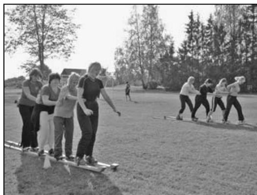
Õpetajad ja Emmeliined võistlemas