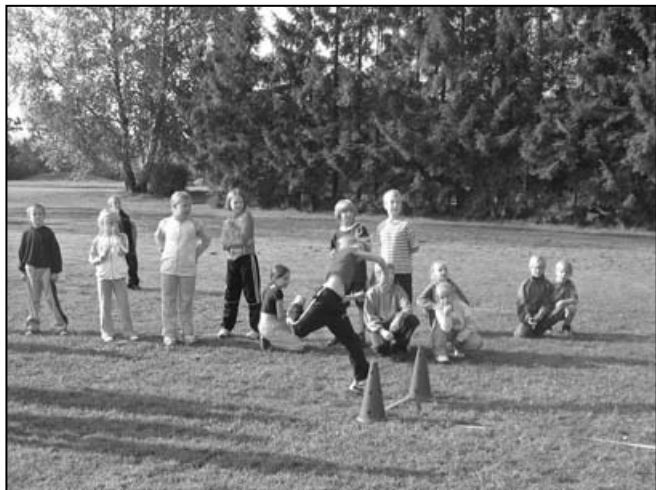
Pallivise algklasside spordipäeval