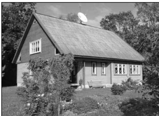
III koht perekond Ojasoo elamu