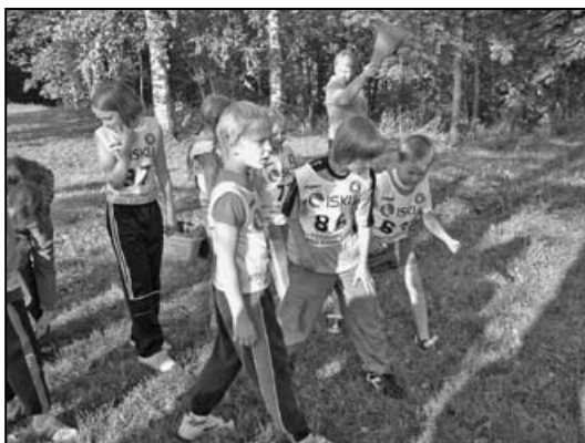
Poisid on stardivalmis