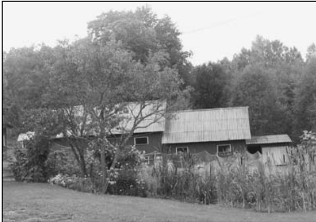
Talviku pere kõrvalhooned suurel kenasti hooldatud territooriumil

Kolisime siia 1968 a. Algul pidasime loomi. Olid olemas aiad nii kanadele, sigadele kui ka lehmadele. Et loomapidamine sai ära lõpetatud, on nüüd karjakopliid muruks muudetud ja kõik ringi kujundatud. Mees oli mul kalamees, kaladele sai rajada tiik. Praeguseks on veel kanad alles, neil on aias head suured lehed kasvamas, kuhu vajadusel kullide eest peitu pugeada.