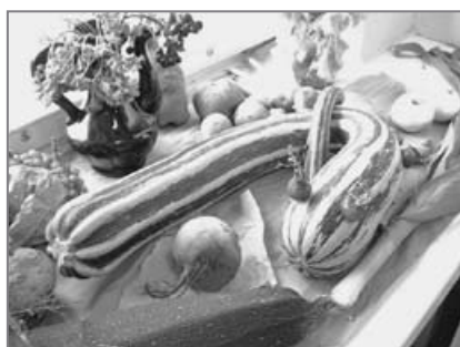
Mida sügis meile tõi