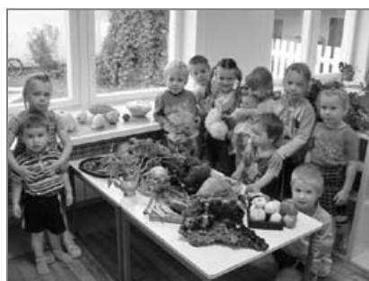
Sügisandide näitus lasteaias