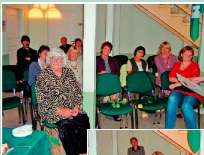
Vallalehe 10.sünnipäevale olid kutsutud endised ja praegused lehetegijad