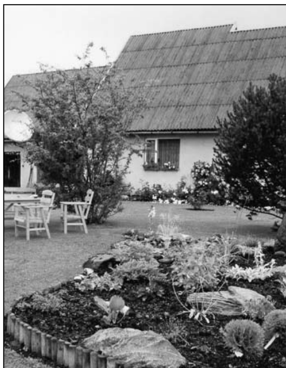
I koht perekond Tekko talumajapidamine