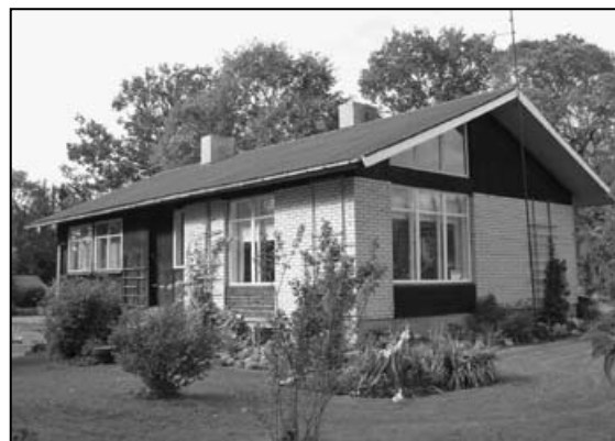
II koht perekond Tiituse elamu